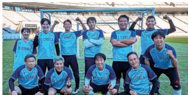
FC・CIRUELA:北沢支部フットサル同好会の名称、CIRUELAはスペイン語で梅。