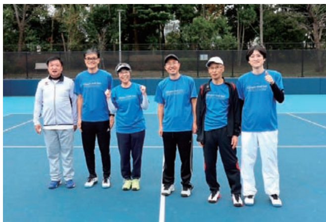
エンジョイチーム